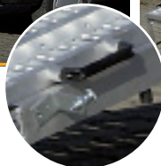
Poignées pour une meilleure préhension