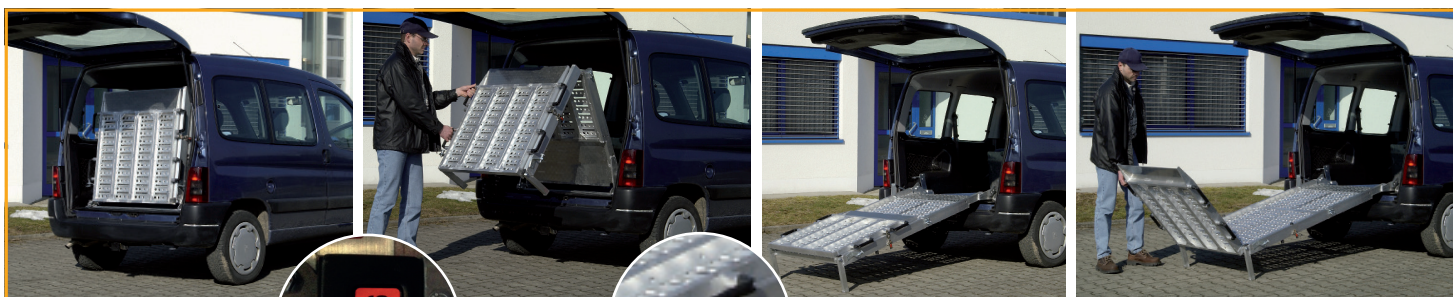
Loquet de blocage de la rampe en position repliée