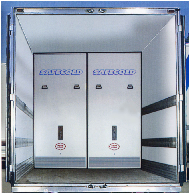
Paroi de séparation SAFECOLD

La nouvelle paroi de séparation SAFECOLD permet de compartimenter les produits dans les semi remorques tout en respectant la chaîne du froid .