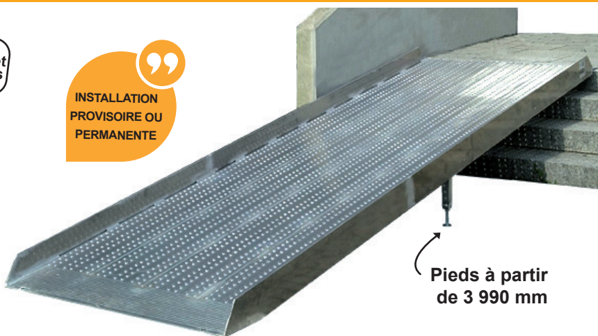
Pieds à partir de 3 990 mm