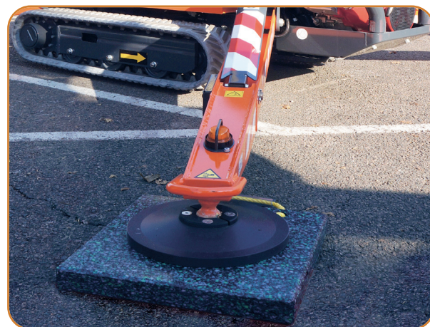
Support pour 2 patins