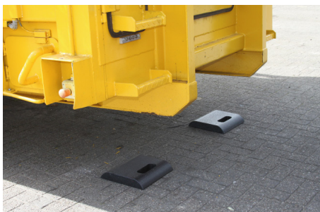
Bloc de positionnement conteneur